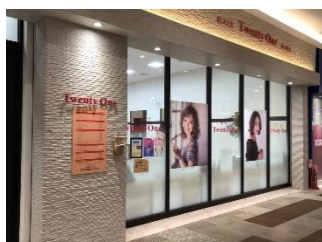
イオンモール 東久留米店