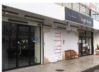
ヴァンティアン東所沢店